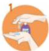
Sprednje stavljaj roke