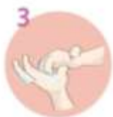
Karkice prstov namočite v kralovno gilo