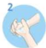
Obrnite dlani ob dlani