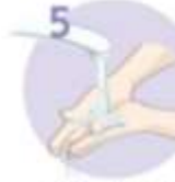
Roke temeljito sperite.