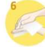
Roke temeljito obrišite s posušenimi brisačo