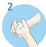
2 Drgnite dlan ob dlan