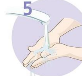
5 Roke temeljito sperite.