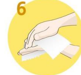
6 Roke temeljito obrišite s papirnato brisačo