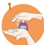
1 Uporabite dovolj mila