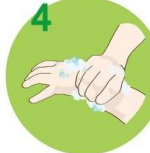
4 Zdrgnite dlani