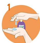
Uporabite dovolj mila