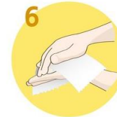
Roke temeljito obrišite s papirnato brisačo