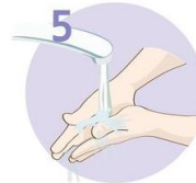
Roke temeljito sperite.