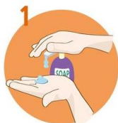
Uporabite dovolj mila