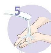
Roke temeljito sperite.