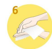
Roke temeljito obrisite s papirnato brisačo