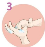
Konice prstov namilite s krožnimi gibi