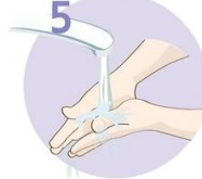
Roke temeljito sperite.