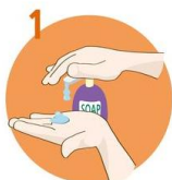
Uporabite dovolj mila