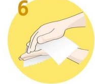
Roke temeljito obrišite s papirnato brisačo