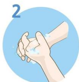
Drgnite dlan ob dlan