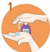
Uporabite dovolj mila