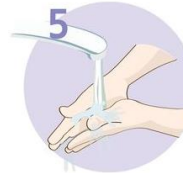
Roke temeljito sperite.