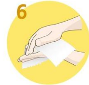
Roke temeljito obrišite s papirnato brisačo