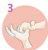
Konice prstov namilite s krožnimi gibi