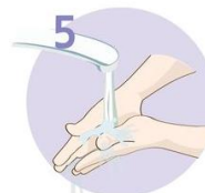
Roke temeljito sperite.