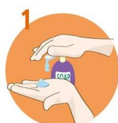
Uporabite dovolj mila