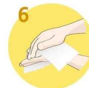
Roke temeljito obrišite s papirnato brisačo