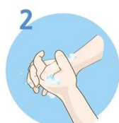
Drgnite dlan ob dlan